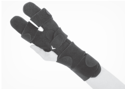
4. PL: Gotowy wyrób. EN: Product is ready to use.