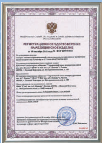
Регистрационное удостоверение на медицинское изделие № РЗН 2009/04666 АМнп-01

Аппарат магнитотерапевтический с низкочастотным переменным магнитным полем воздействия зарегистрирован в Федеральной службе по надзору в сфере здравоохранения (РОСЗДРАВНАДЗОР).