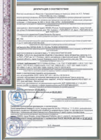
Разрешительное удостоверение Сертификат соответствия