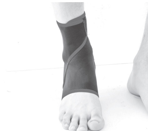
3. PL: Gotowy wyrób. EN: Product is ready to use.