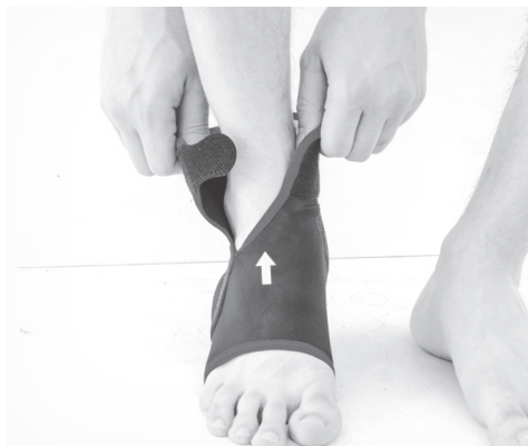
1. PL: Rozepnij ortezę i załóż na nogę. EN: Unfasten the brace and put on the leg.