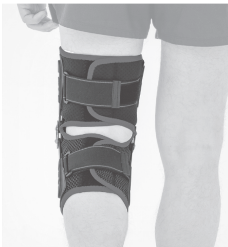
4. PL: Gotowy wyrób. EN: Product is ready to use.