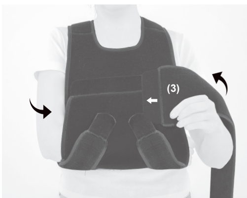
5. PL: Przypomnij pas obwodowy (3), owiń go wokół tułowia i zapnij z przodu. EN: Attach the immobilizer band (3), wrap around the trunk and fasten the Velcro closure.