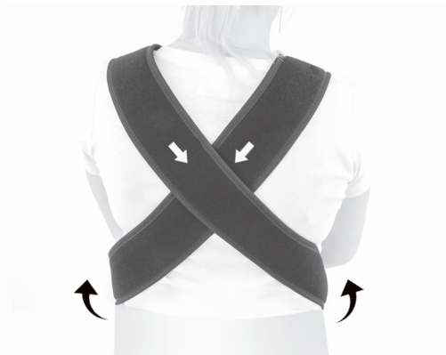
3. PL: Skrzyżuj tylne pasy naramienne. EN: Cross the shoulder straps.