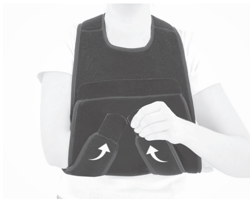
4. PL: Zapnij rzepowe zapięcia z przodu temblaka. EN: Fasten the Velcro closures on the sling.