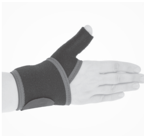
4. PL: Gotowy wyrób. EN: Product is ready to use.