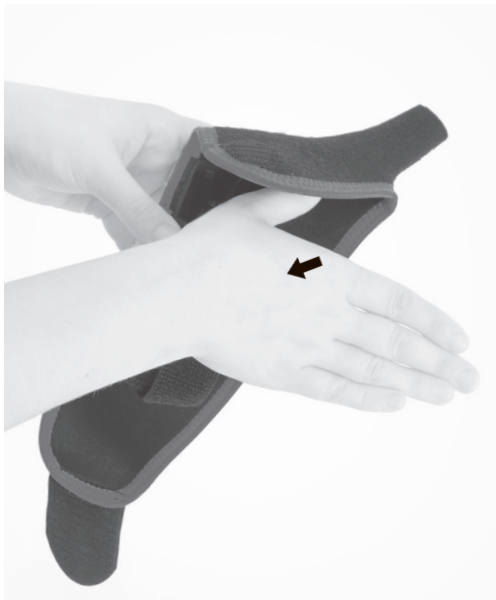
1. PL: Umieść kciuk w ortezie. EN: Put the thumb in a brace.