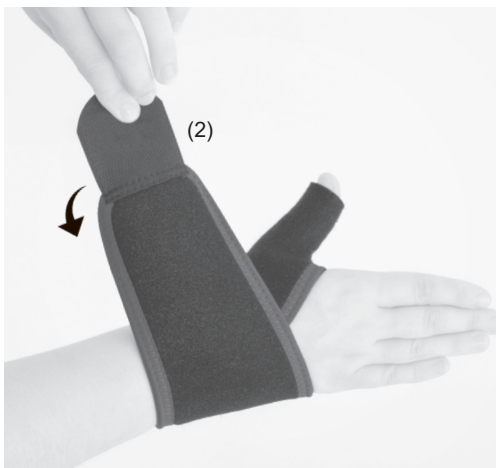
3. PL: Zapnij rzep (2). EN: Fasten the Velcro closure (2).